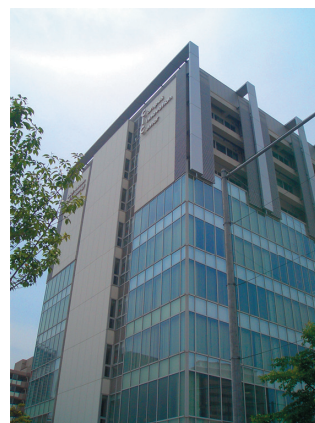
キャンパス・イノベーションセンター

※イノベーションマネジメント研究科の各キャンパスの詳細は下記のURLよりご確認ください。 http://www.mot.titech.ac.jp/campus.html